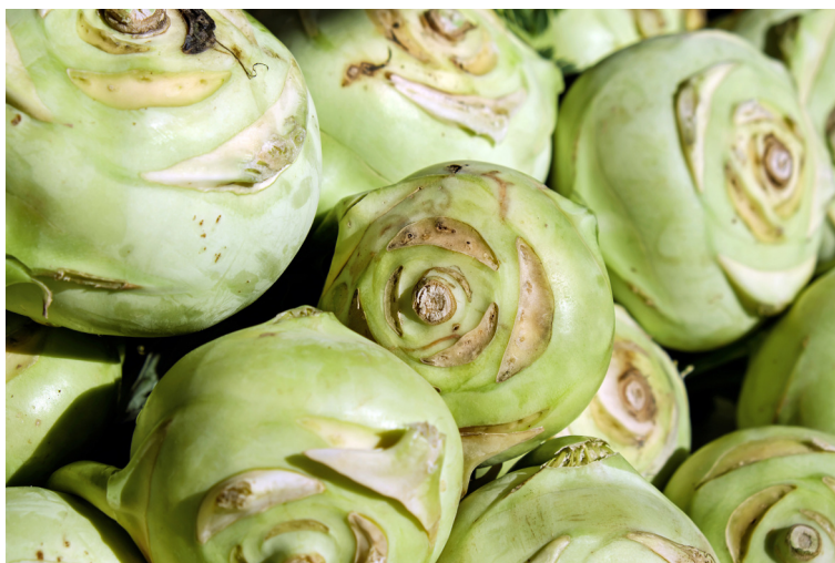
Figuur 7.3: Koolrabi, verkleind